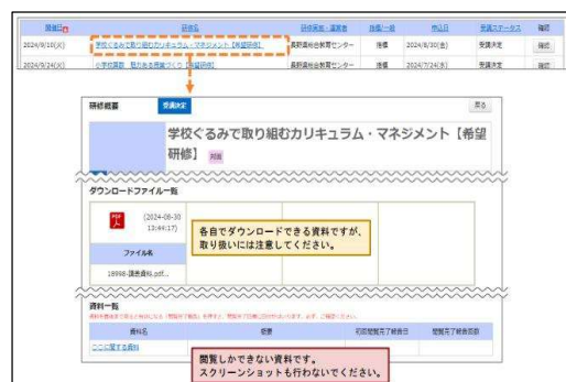
「研修資料の閲覧」の画面